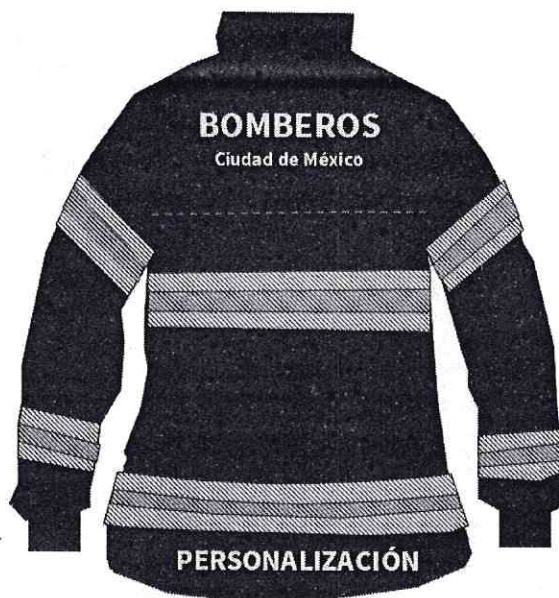
Figura 4 Chaquetón espalda Imagen ilustrativa