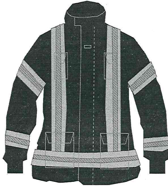
Figura 3 Chaquetón frente Imagen ilustrativa

BRAZOS: DOS TIRAS HORIZONTALES: CINTAS REFLEJANTES, SEGMENTADAS, FUSIONADAS AMARILLO / PLATEADO / AMARILLO, QUE CUMPLA CON PARÁMETROS DE: RESISTENCIA TÉRMICA, RESISTENCIA A LA PROPAGACIÓN DE LLAMA, ASÍ COMO RESISTENCIA AL LAVADO. (FIGURAS 3 Y 4.)