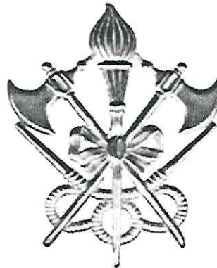
Figura 2. Escudo de Fuego