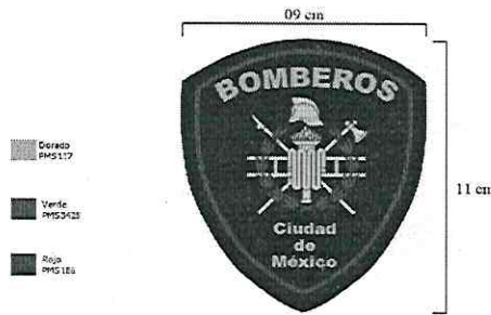
Figura 3: Especificaciones Para escudo manga izquierda

MANGA DERECHA: EN LA MANGA DERECHA LLEVA UN ESCUDO RECTANGULAR CON LA IDENTIDAD GRÁFICA DE LA ADMINISTRACIÓN DE LA CIUDAD DE MÉXICO EN MICRO BORDADO O MATERIAL CODIFICADO (A ESPECIFICAR), SE CONFORMA DE UN RECTÁNGULO 8.5 CM DE BASE POR 7 CM DE ALTURA, SE COLOCARÁ A 4.5 CM DE LA UNIÓN DE MANGA HACIA ABAJO (CANESÚ) Y SU CONSTRUCCIÓN SERÁ CONFORME A LO SIGUIENTE: (FIG 4)