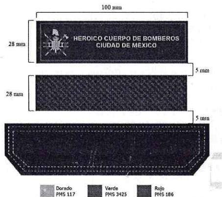
Figura 2: Especificaciones para gafetes

NO DEBERÁ LLEVAR RIBETES NI BORDES EN SU CONTORNO.