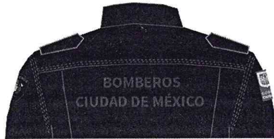
Figura 5: Especificaciones para bordado trasero.